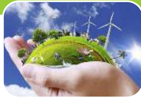
Природные ресурсы планеты Земля