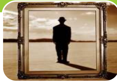
История и личность