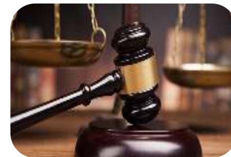
Я и закон