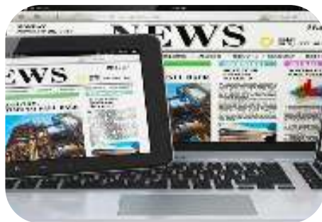
Молодёжь и средства массовой информации