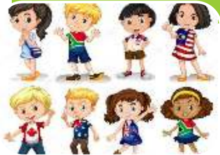
Культура народов мира