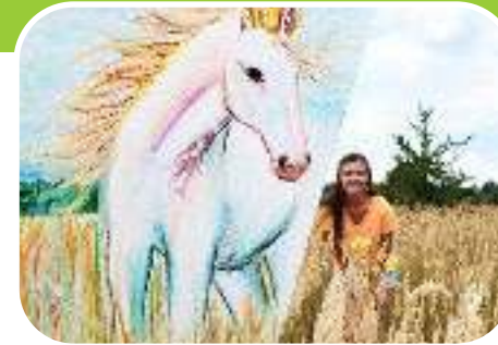
Реальность и фантазия