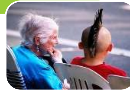
Отцы и дети: диалог и конфликт поколений